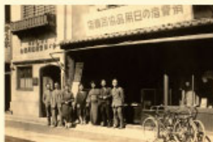
生協運動：初期の雲柱社では松沢生協の設立を支援し、関東地方における生活協同組合結成の拠点となりました。各地に生活協同組合が設置され、現在でも生協やCO-OPという名称で広く親しまれ、活動を継続しています。