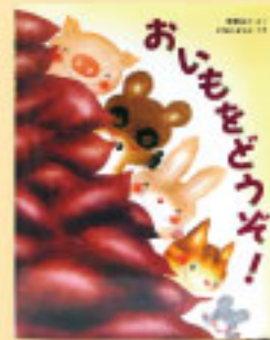
柴野民三原作 いちもようこ文・絵 定価 1,200 円