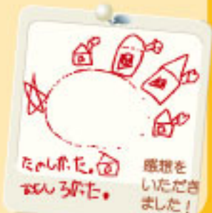
感想を いただき ました！