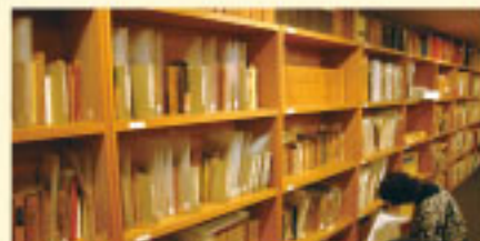
著作活動：代表作の「死線を越えて」のほか、雑誌連載、風刺画、児童書、詩、短歌など、さまざまな作品を生みだしました。